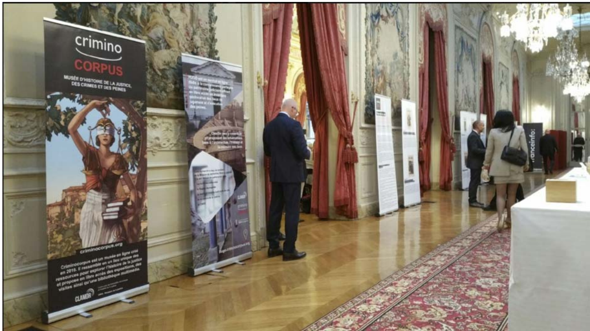
[13 juin 2019 - Criminocorpus présente l'exposition "Meurtres à la Une" de Pierre Piazza dans le cadre du colloque des 30 ans de l'Inhesj à l'Assemblée Nationale.]