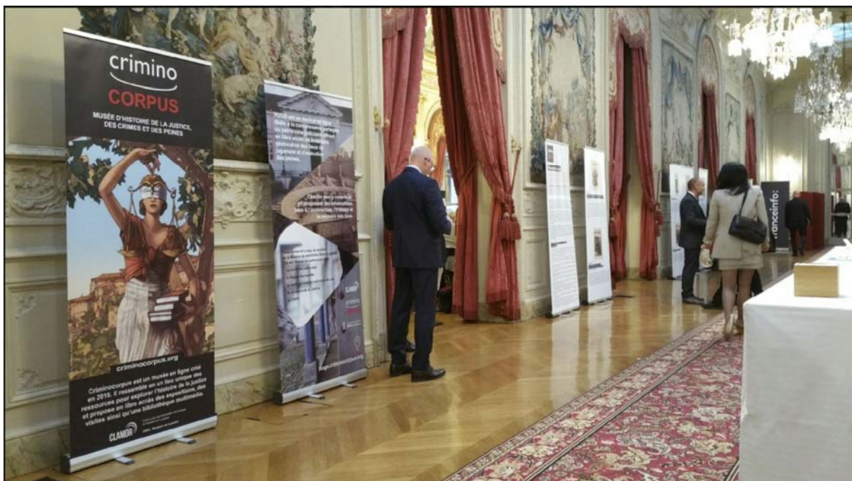
[13 juin 2019 - Criminocorpus présente l'exposition "Meurtres à la Une" de Pierre Piazza dans le cadre du colloque des 30 ans de l'Inhesj à l'Assemblée Nationale.]