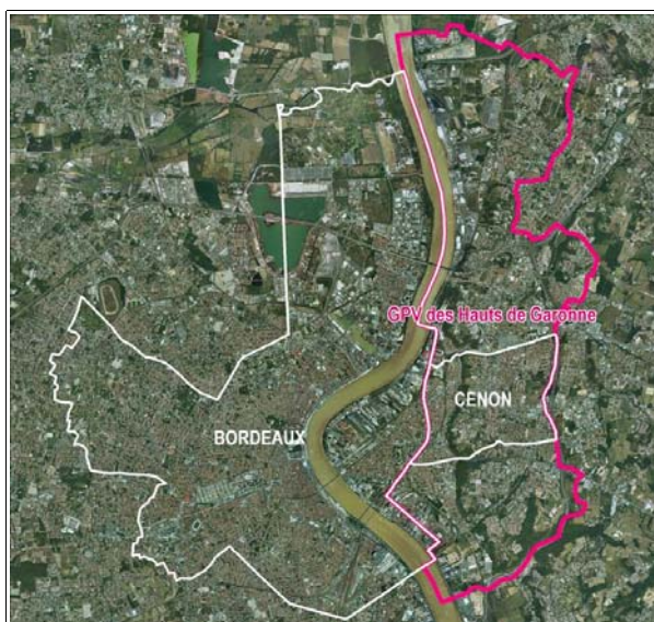
GPV des Hauts de Garonne, commune de Cenon Sources : BD Carto 2007 et BD Ortho 2004 Réalisation : CETE SO

Le bailleur Logévie, anciennement L'habitation économique, dispose de 6 500 logements répartis sur le territoire Aquitaine. Deux tiers de ces logements sont réservés aux personnes âgées. L'ensemble immobilier Virecourt est le seul patrimoine de Logévie sur le quartier du 8 mai 1945.