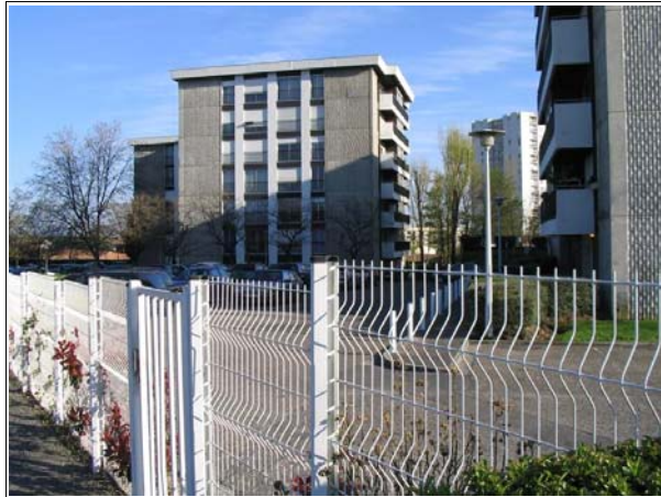
Clôture « étanche » entourant le site

Le bailleur explique que, face à un environnement perçu comme de plus en plus hostile, les habitants ont affiché une forte demande de sécurité. La pose d'une clôture entourant la résidence était alors présentée comme un moyen pour se mettre « à l'abri ».