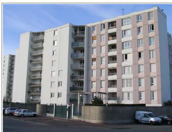
La clôture entourant la résidentialisation se veut particulièrement étanche.