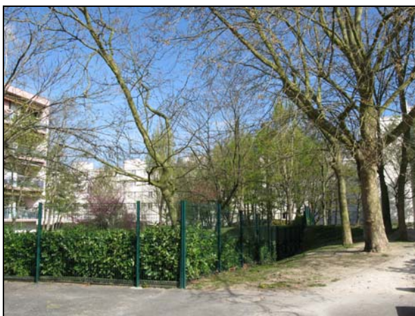
Copropriété privée clôturée jouxtant la résidence Château d'eau

La résidentialisation a également pour objectif de favoriser l'appropriation des espaces collectifs par les habitants. Pour le bailleur, la clarification entre l'espace privé et l'espace public est nécessaire pour que les locataires s'approprient et respectent leurs espaces.