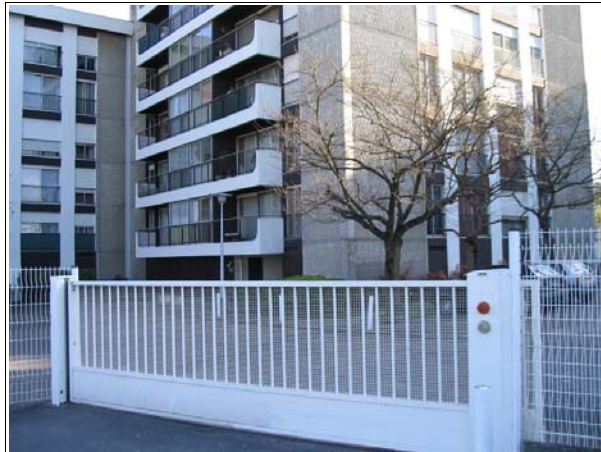
Un portail coulissant permet l'accès aux véhicules : le stationnement est intégré dans l'espace fermé