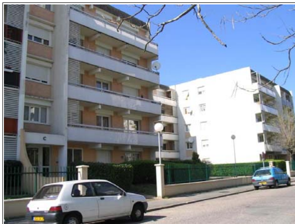
Les entrées sont laissées ouvertes

Par ailleurs, le bailleur souligne que la résidentialisation a contribué à l'amélioration de l'image de la résidence. Il explique que les locataires des bâtiments voisins, qui soulignent l'esthétisme de la résidence Helsinki, souhaiteraient un projet similaire pour leur immeuble.