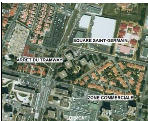
Square Saint-Germain Réalisation : CETE SO

Le square Saint-Germain compte 150 logements répartis sur 5 bâtiments distincts. Le site comporte plusieurs atouts : il est relativement calme, est desservi par le tramway et se situe à proximité des commerces. Les occupants de la résidence sont en moyenne plus âgés que les habitants de Génicart.