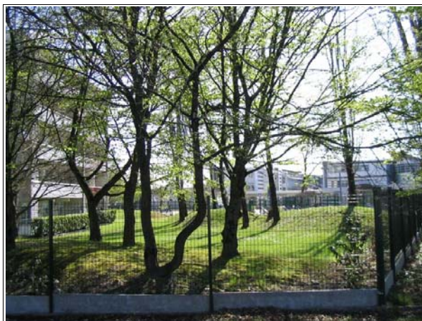
Le bailleur a tenu à préserver le parc derrière la résidence

Pour résoudre les deux premiers points, la solution retenue consiste en la résidentialisation partielle du bâtiment. Pour le bailleur, il s'agit d'apporter une réponse à un « problème ponctuel de circulation naturelle ». L'objectif est de mettre à distance les flux de piétons, non de protéger contre l'intrusion.