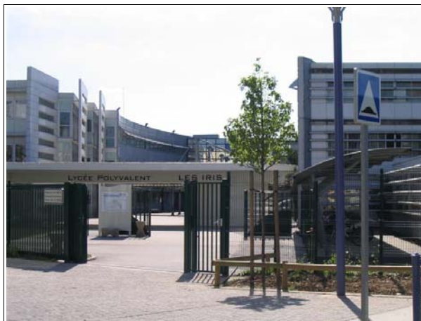
L'entrée principale du lycée des Iris est située face à la résidence