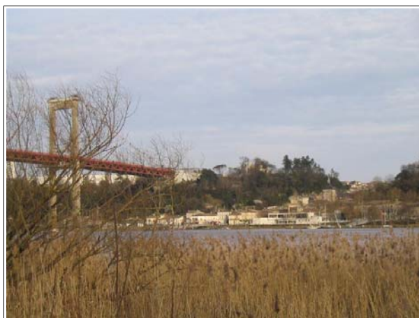
Les Berges de la Garonne confèrent au site un cadre apprécié par les résidents.

Le CCPD a décidé de mettre en place un plan de sauvegarde impliquant l'ensemble des acteurs. Le plan de sauvegarde comprenait un fort volet social (recrutement d'un animateur social, actions d'accompagnement social, mise en place d'une Mous etc.), il visait à restructurer et à requalifier le quartier et prévoyait l'ouverture d'un bureau de police à proximité de la cité. La requalification et la sécurisation de la cité du Port de la Lune s'inscrivaient pleinement dans ce plan.