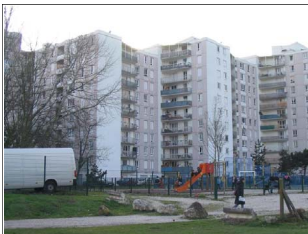
Cité du Port de la Lune - division en 7 unités

Si les problèmes sont beaucoup moins importants, la situation reste néanmoins compliquée. Le bailleur note des dégradations régulières ainsi que des occupations problématiques de certains halls d'entrée.