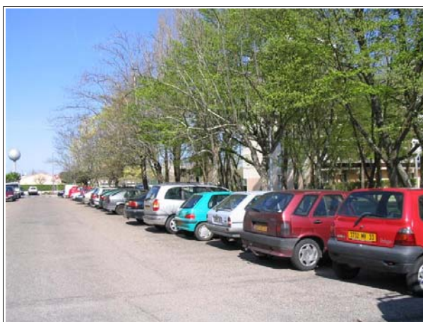
Le stationnement n'est pas intégré dans le projet. Les places de parking sont situées côté rue.