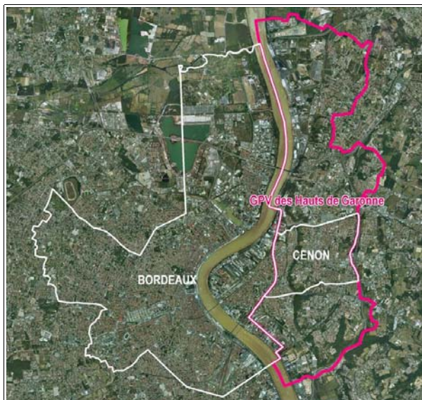
GPV des Hauts de Garonne, commune de Cenon Réalisation : CETE SO

Le bailleur Logévie, anciennement L'habitation économique, dispose de 6 500 logements répartis sur le territoire Aquitaine. Deux tiers de ces logements sont réservés aux personnes âgées. L'ensemble immobilier Virecourt est le seul patrimoine de Logévie sur le quartier du 8 mai 1945.