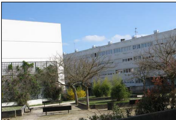
Aménagement des espaces extérieurs

La mairie de Lormont considère que la résidentialisation de la résidence Château d'eau, qui vient compléter les aménagements préexistants, est simple mais réussie. Pour le bailleur, la valorisation de l'ensemble immobilier a augmenté son attractivité : les logements de Château d'eau sont très demandés. D'après une association de quartier, les résidents se montrent également satisfaits. L'association explique cette réussite par un « terrain favorable » : les voisins se connaissent bien, ils échangent et se sont fortement impliqués dans le projet.