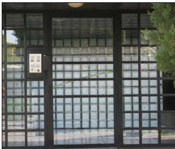
Sécurisation des halls d'entrée avec pose de miroirs et d'interphones

La résidentialisation s'est déroulée en plusieurs étapes. Le bailleur a d'abord sécurisé les halls d'entrée avec, notamment, le renforcement de l'éclairage et la mise en place de miroirs. Il a ensuite aménagé les espaces extérieurs et amélioré l'usage des cheminements piétons. Il a également matérialisé les espaces tampons avec différentes plantations. Les entrées ont été numérotées et séparées. Mésolia a également mis en place une haie surmontant les murets existants. En 2008, la fermeture restait symbolique mais le bailleur prévoit d'installer des dispositifs de contrôle d'accès.