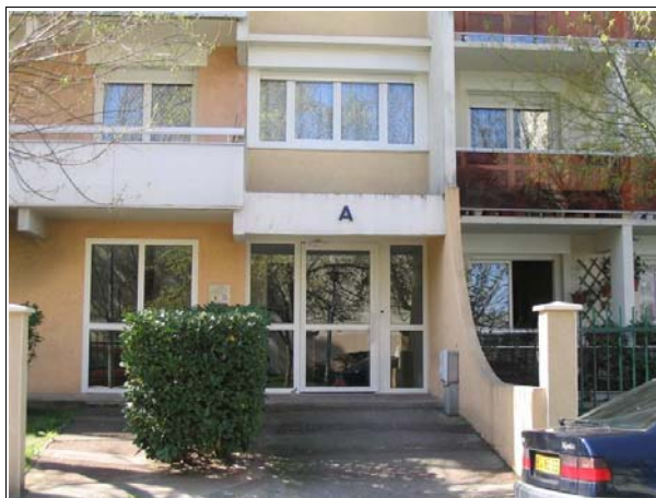
Chaque entrée est en accès libre