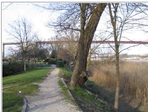
Promenade à l'est de la cité