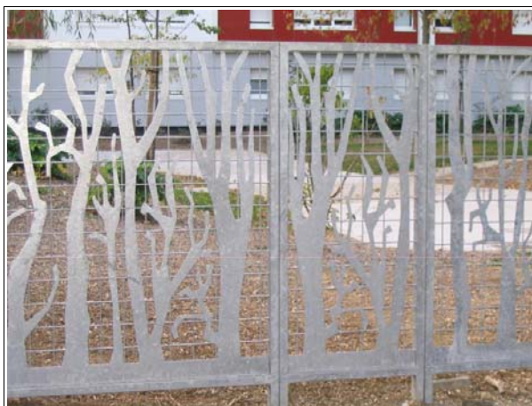
La clôture choisie est particulièrement originale. L'architecte a proposé la mise en place de motifs en tôle découpée.