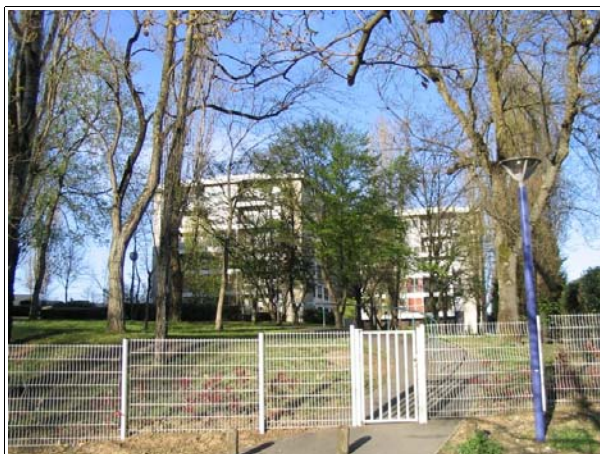
Un dispositif de contrôle d'accès est aussi installé pour les piétons

Le directeur de l'antenne rencontré émet cependant quelque réserve. Cette privatisation favoriserait le développement de l'auto-contrôle, soit une forme de contrôle social informel, ce qui pose question en terme de liberté individuelle.