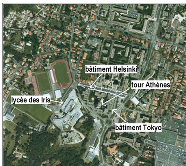
Résidence Olympie (Helsinki, Athènes, Tokyo) Sources : BD Carto 2007, BD Ortho 2004 Réalisation : CETE SO

Helsinki est un immeuble convoité. Il connaît une faible vacance et le taux de rotation est minime.