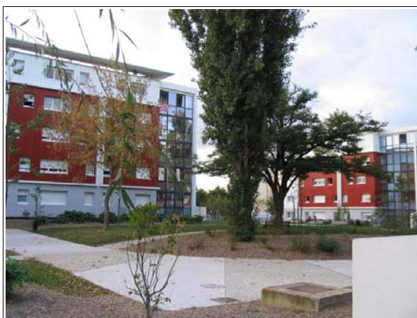
Le bailleur a choisi de réaliser un espace paysager central de qualité pour chaque îlot

La végétation a été choisie afin de ne pas générer un entretien trop coûteux. Le bailleur a toutefois pris soin de contracter une garantie permettant de remplacer ce qui périclète ou est détruit.