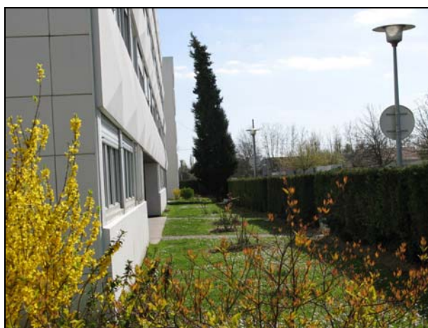
Espaces tampons agrémentés de plantation