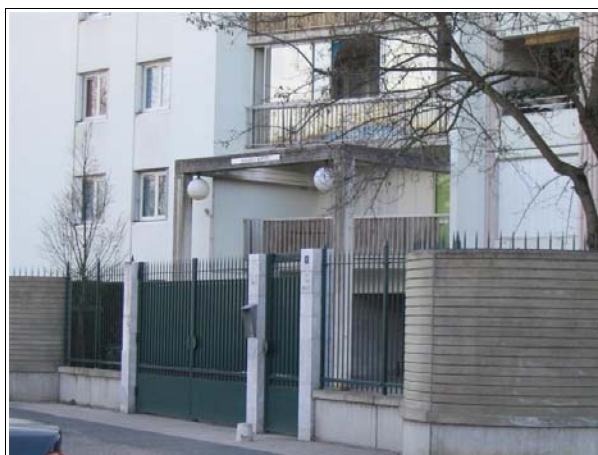
Les dispositifs de contrôle d'accès sont aujourd'hui considérés comme très agressifs.

La cité du Port de la Lune est une des premières opérations de ce type réalisées par Maison Girondine. Depuis, les pratiques du bailleur ont beaucoup évolué : aujourd'hui, il réalise des projets de résidentialisation et n'emploie plus le terme de sécurisation. Les objectifs affichés portent désormais sur l'amélioration du cadre de vie, la valorisation de la résidence, l'appropriation et le respect des espaces etc. Le bailleur ne résidentialise plus pour sauvegarder son patrimoine mais pour le rendre plus attractif et le mettre à niveau par rapport aux nouvelles constructions.