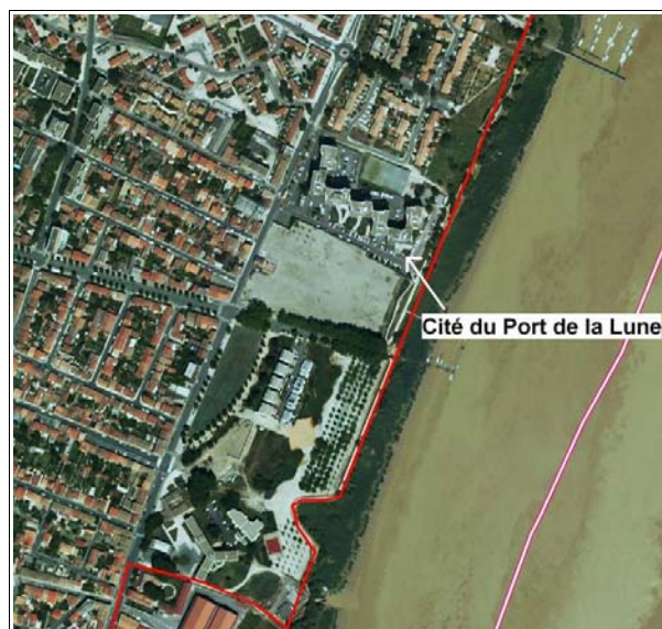
Cité du Port de la Lune Réalisation : CETE SO

La majorité des logements correspondent à un conventionnement PLUS (prêt locatif à usage social). Les loyers sont parmi les plus attractifs du parc de Maison girondine. L'objectif de mixité sociale affiché par le bailleur est difficile à réaliser.