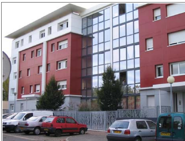
La réfection des façades en rouge et blanc ainsi que les baies vitrées ont fortement contribué à l'amélioration de l'esthétique de la résidence

La résidentialisation, telle qu'elle est achevée depuis fin 2007, n'a pas toujours été pensée ainsi. Dans un premier temps, le bailleur souhaitait surtout réhabiliter la résidence. Après concertation avec les habitants, il a ainsi élaboré un programme comprenant diverses actions (isolation thermique des logements, réfection des façades, etc.). Pour accompagner cette lourde réhabilitation, le bailleur a proposé une résidentialisation partielle destinée à aménager des espaces paysagers agréables. Cette résidentialisation légère prévoyait de laisser ouvertes les entrées des bâtiments. Le projet a ensuite été validé puis inscrit dans la convention ANRU, signée en 2005.