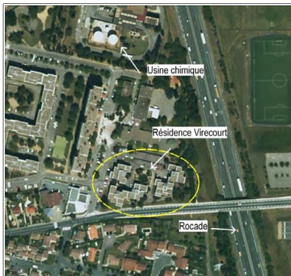
Résidence Virecourt Réalisation : CETE SO

Bordée par la rocade de Bordeaux et jouxtant une usine chimique (réseaux de chaleur raccordé à l'unité d'incinération de Cenon), la résidence est particulièrement enclavée. Par ailleurs, le site est au cœur d'un projet de recomposition et d'évolution urbaine. Un réaménagement de la voirie sera prochainement effectué. Et, suite à la démolition d'une barre emblématique du quartier, des résidences neuves feront bientôt face à l'ensemble immobilier Virecourt.