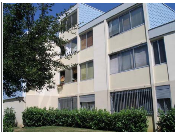
Les pieds d'immeuble avant la résidentialisation

Des négociations s'engagent alors entre le bailleur, les services de l'État et la collectivité. Des réunions sont organisées, des courriers sont échangés etc. Le projet est suspendu pendant plus d'un an.