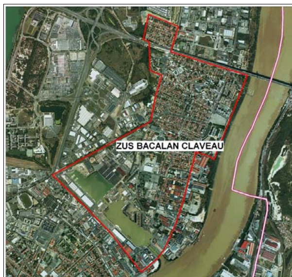
ZUS Bacalan Claveau Sources : BD Carto 2007 et BD Ortho 2004 Réalisation : CETE SO

L'organisme bailleur, Maison Girondine, est une Entreprise sociale de l'habitat (ESH) créée en 1969 qui appartient au groupe Toit Girardin. Le groupe possède et gère 8 000 logements en Gironde.