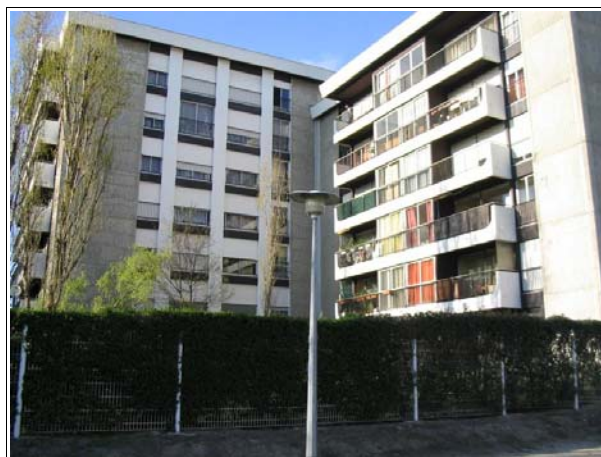
Le bailleur a souhaité améliorer la qualité visuelle de la clôture en végétalisant

Afin d'élaborer, en terme de conception, les principes de la résidentialisation, le bailleur s'est entouré de personnes jugées compétentes : architectes, urbanistes etc. Aujourd'hui, Domofrance intègre systématiquement la résidentialisation dans les nouvelles constructions.