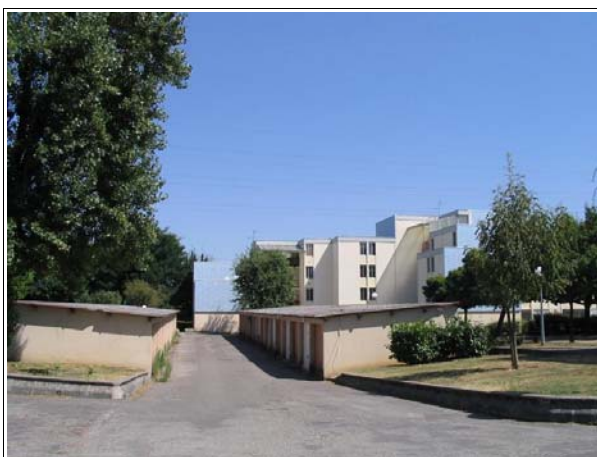
La résidence Virecourt comporte plusieurs garages fermés

Pour concevoir son projet, le bailleur a sollicité un bureau d'ingénierie. Il a également organisé des concertations avec les locataires. Logévie envisageait de démarrer les travaux dès le 2 e semestre 2006.