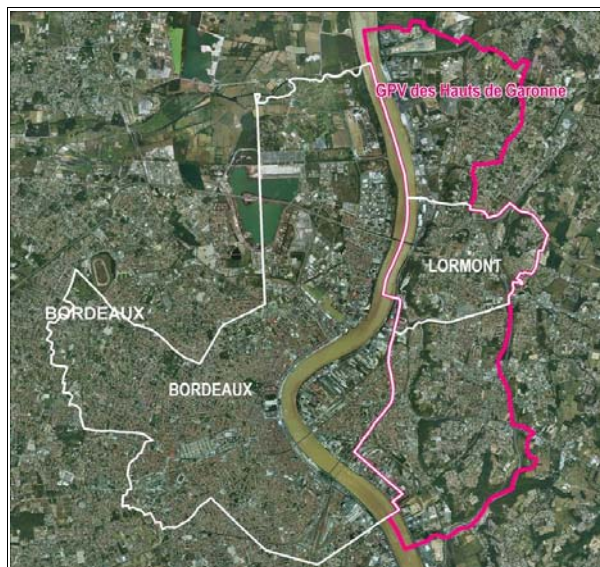
GPV des Hauts de Garonne, commune de Lormont Sources : BD Carto 2007 et BD Ortho 2004 Réalisation : CETE SO

Le foyer de la Gironde possède une seule résidence sur le quartier : la résidence Olympie. Cette dernière, qui comporte 262 logements, est composée de deux bâtiments de quatre étages : Helsinki et Tokyo, et d'une tour : la tour Athènes.