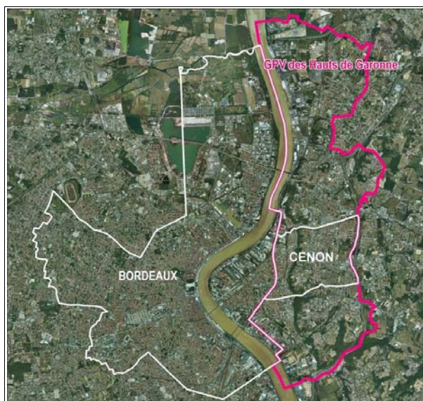
GPV des Hauts de Garonne, commune de Cenon Sources : BD Carto 2007, BD Ortho 2004 Réalisation : CETE SO

La résidence est située au sein du nouveau cœur du quartier, à proximité de la mairie annexe et d'une nouvelle place : la place Laredo, qui abrite une dizaine de commerces. Depuis février 2007, le site est desservi par le tramway.