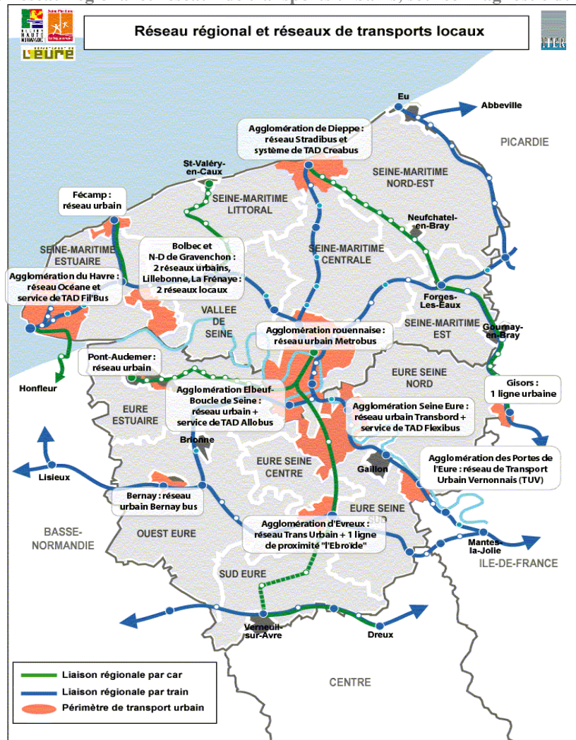
Carte du réseau régional et réseaux de transports urbains

Le réseau d'Yvetot et celui des Andelys ne figurent pas sur la carte.