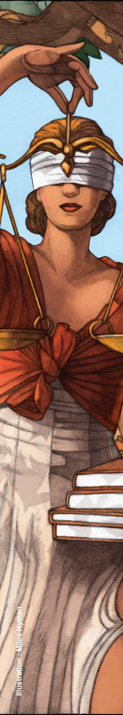
Illustration : Miles Hyman

Centre pour les humanités numériques et l'histoire de la justice CNRS - UMS 3726