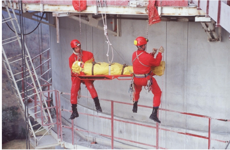
Figure 1 Sauvetage mettant en œuvre des équipements de protection individuelle Rescue operation making use of personal protective equipments