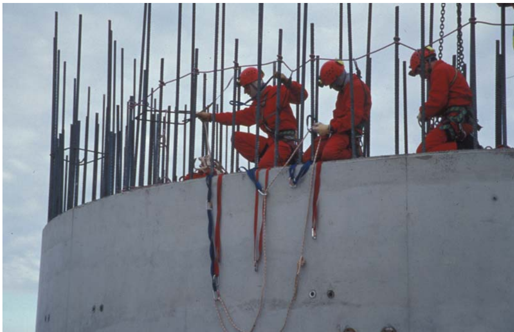
Figure 4 Utilisation des équipements de protection individuelle (EPI) sur un chantier de construction

Pour ce type d'équipements, les fibres utilisées sont soit le polyester (PET) soit le polyamide (PA6 et PA66) soit le polypropylène (PP).