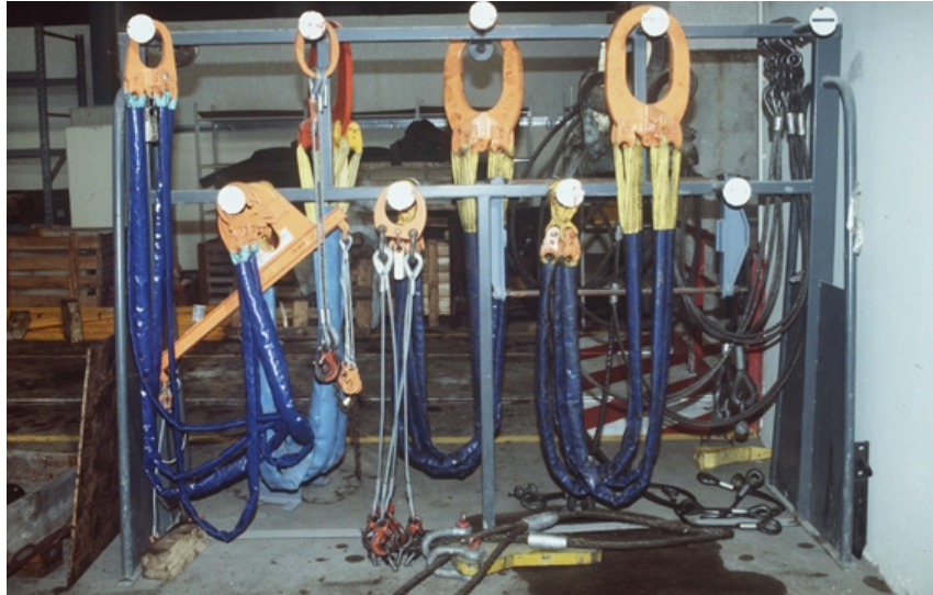
Figure 3 Elingues textiles Textile slings

Les équipements utilisés à l'extérieur, par exemple sur les chantiers de construction, sont constamment exposés au rayonnement solaire (cf. Figure 3).